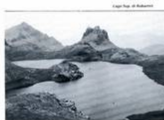
Lago Sup. di Roburent

Pratorotondo, Gr. Respiandino, Fasso dell'Escalon, Colle della Scoletta, Lago Superiore di Roburent (m 2450). Calcari e dolomie in ripide creste caratterizzano la peculiare morfologia della dorsale superiore Val Maira - Valle Stura. Attorno al Lago Sup. di Roburent affiorano rocce di varia natura metamorfica: gneiss, quarziti, scisti violacei e cendrosi. Dallo stesso lago in mezz'ora di cammino è raggiungibile oltre confine, attraverso il Colle di Roburent (m 2490), il Lago dell'Ornaghe. Dislivello complessivo in salita: m 1200. Tempo previsto: n. 4. Partenza da Bra alle Stazioni h 6.00. Proposta da D. Brizio e R. Carlotta.