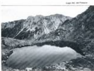
Lago del Frison