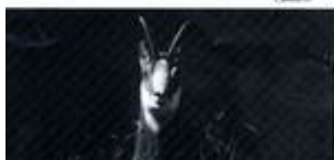
di R. Tibaldi

Sabato 7: S. Anna di Valdieri, Glas del Prato, C. del Chiot, Rif. L. Bianco (m 1852). Dislivello in salita: m 800; tempo previsto: n. 3. Partenza da Bra alle Stazioni h 14.30. Domenica 8: Rif. L. Bianco, L. Sopr. di Sella, Laghi del Matto, Colle del Matto, Cima Est del Matto (m 3080). Dislivello in salita: m 1200; tempo previsto: n. 4.30. Il primo giorno prevede una agevole salita, nel vallone della Piana popolata di camosci, al ristrutturato rifugio L. Bianco sulle sponde del Lago Inf. di Sella. Il itinerario del secondo giorno, secco, in ambiente quantomai arido, una serie di brevi e salienti laghetti alcuni permettono di fare osservazioni sui fenomeni glaciali e morfologici tra i più esuberanti del gruppo vinti Argentera. Il eccezionale panorama sull'imponente massiccio Ovest dell'Argentera e sulla pianura cuneese e il profilo di questa lunga escursione. È possibile effettuare la discesa nel vallone di Valasco attraverso il Passo Cabrera ed il sentiero che scende dal Colle di Sabiana. Proposta da R. Tibaldi e O. e M. Collino