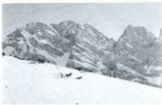
di M. Marguaretta

Pian delle Corre, Glas Sott. di Sestera, Glasel, Olias Sopr. di Sestera, Rif. Garelli (m 2000). Nel Parco Naturale dell'Alta Valle Pesio sono censite oltre 1.300 unità botaniche, tra cui molti endemismi. La particolare collocazione del territorio del parco favorisce la crescita di piante esotterranee, ciononostante in alta quota. L'aquila è sicuramente l'animale di maggior richiamo e non è raro assistere. Dal rifugio Garelli in salita si raggiunge il P. Serpentera (m 2505): ampio panorama su valle Elero, Mongioie, Mondolè, Quilic, Marguaretta e laghi delle Moglie e Biscat. Itinerario in discesa attraverso i laghetti del Marguaretta. Dislivello in salita: m 1100 ca. Tempo previsto: n. 3.30. Partenza da Bra alle Stazioni h 6.30. Proposta da O. e M. Collino e B. Rosania.