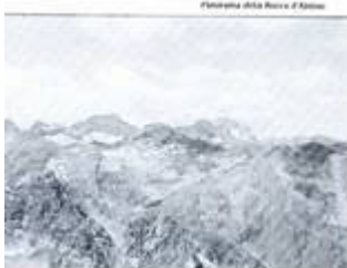
Fotografia della Rocca d'Abisso

Colle di Tenda, Forte Giavera, Prà Giordano, Rocca dell'Abisso (m 2755). Il percorso si snoda a cavallo del confine italo-francese, tra la Val Vermenagna e la Val Royal. A testimonianza dei numerosi accadimenti storici verificatisi in questa zona stanno le opere militari e le fortificazioni, tra loro collegate dalle strade da cannoni, del panorama dalla Rocca dell'Abisso sui laghi di Peralica e su tutto il vallone del Sabbione fino a Entracque. Dislivello in salita: m 900. Tempo previsto: n. 3.30-4. Partenza da Bra alle Stazioni h 6.00. Proposta da O. e M. Collino e A. Alberelli.